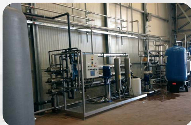
PRODUZIONE ACQUA DI REINTEGRO CENTRALE VAPORE (OSMOSI INVERSA ED ADDOLCITORE DUPLEX PORTATA 12 MC/H)